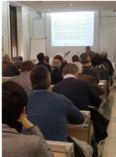
Foto 2 – Corso in materia di costi della sicurezza presso Ordine Ingegneri Teramo -2019