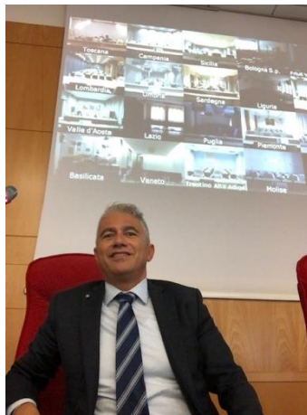
Foto 3 – INPS – Direzione Generale- Lezione in videoconferenza con le Direzioni Regionali in materia di appalti pubblici -2019

Durante il Dottorato di ricerca sono state svolte lezioni in materia di LL.PP. presso L'università Politecnica delle Marche – Facoltà di Ingegneria- Istituto IDAU ( Prof. Berardo Naticchia) e presso strutture esterne ( es. Banca di Italia –Roma Direzione Generale)