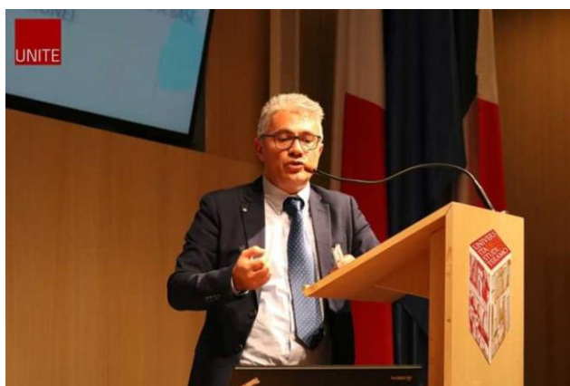
Foto 4 - Convegno Università di Teramo 14 marzo 2019 Seminario di studi - GLI APPALTI E I CONTRATTI PUBBLICI:STRUMENTO VIRTUOSO PER

Durante il Dottorato di ricerca sono state svolte lezioni in materia di LL.PP. presso L'università Politecnica delle Marche – Facoltà di Ingegneria- Istituto IDAU ( Prof. Berardo Naticchia) e presso strutture esterne ( es. Banca di Italia –Roma Direzione Generale)