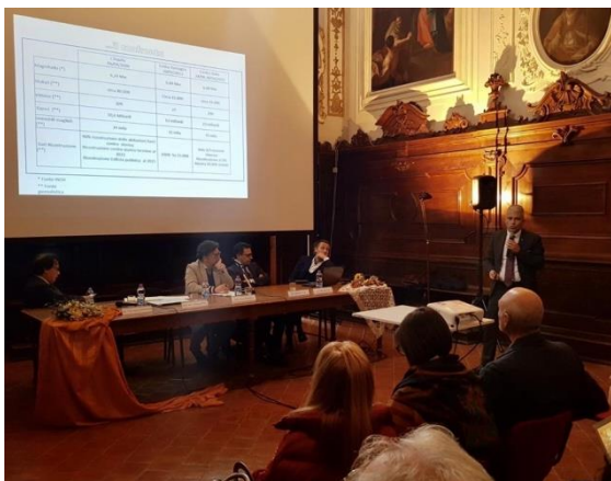
Foto 5 - Bentley Soa Palazzo dei Nobili – L'Aquila – 12.11.2019 Convegno TERREMOTO E RICOSTRUZIONE - CRITICITA' E PROSPETTIVE