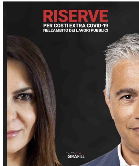
2020 Co-Autore Libro " RISERVE per COSTI EXTRA COVID-19 "