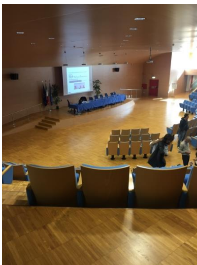
Foto 1 - Lezioni in materia di lavori pubblici presso la sede della Regione Friuli Venezia Giulia